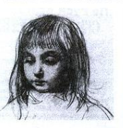
Иван Пиколов "Вирши Ксении в голубой шляпе", 2005 г.