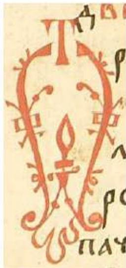
Буква отъ из псалтири 16 века