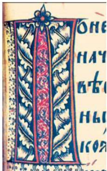
Буква «П». Евангелие 16 век