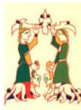
Псалтирь. Новгород 14 век

* притоло́ка (притолока) — верхний брус в дверях.