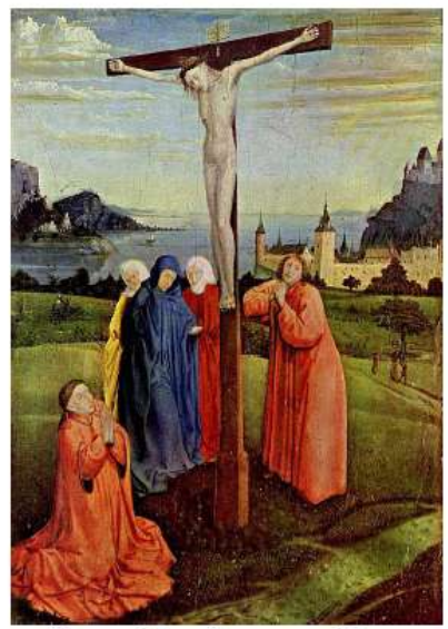
Конрад Виц. Распятие. 15 век

писцы. Буквица, как крепкое дерево, прочно стоит, держа в равновесии свои ветви. По форме буква Т повторяет одну разновидностей креста — «евангельского». Крест такой формы на своих одеяниях основатель ереста святой Антоний Великий. На аках средневековых художников мы увидим такой крест. о происхождению буква Т