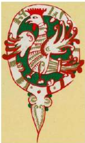
Буква онѧ из Новгородской псалтири 14 века