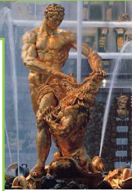
«Самсон, раздирающий пасть льва».

розный Христа одивого творца повелел вигнуть Покрова одицы, й день Собор ого.