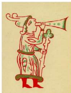
Евангелие. Новгород 14 век