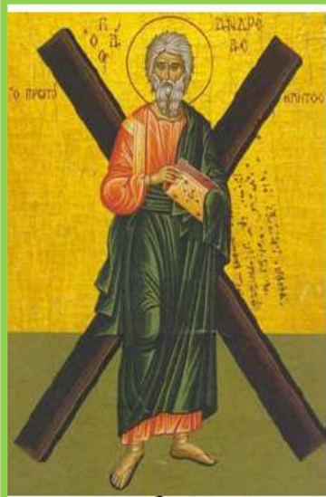
Свѣтый апѣлъ Андрей Первозванный

Самуи́л (Сампсон) — герой Ветхого Завета, наделённый сверхъестественной силой. апостол Андрей Первозванный был распят на таком кресте. Этот крест считали символом имени Христа. Ведь имя Христосъ (Христос) начинается с Х . В России синий крест изображается на флаге военных судов. Такой флаг называется Андреевским и является знаменем Военно-Морского Флота России.