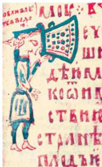
Буква «Р». Евангелие. Великий Новгород, 1355.