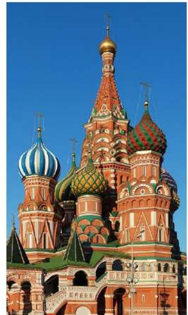
Собор Василия Блаженного

розный Христа одивого творца повелел вигнуть Покрова одицы, й день Собор ого.