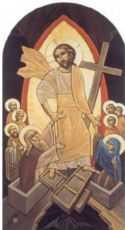
икона Воскресения Христова

Слово «рцы» имеет множество «родственников» — однокоренных